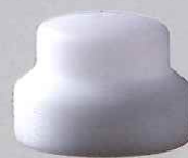
さざ波ノズル用 ヘッドチップ25mm