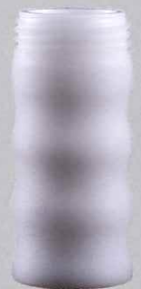
さざ波ノズル用 シャフト