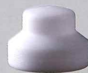
さざ波ノズル用 ヘッドチップ20mm